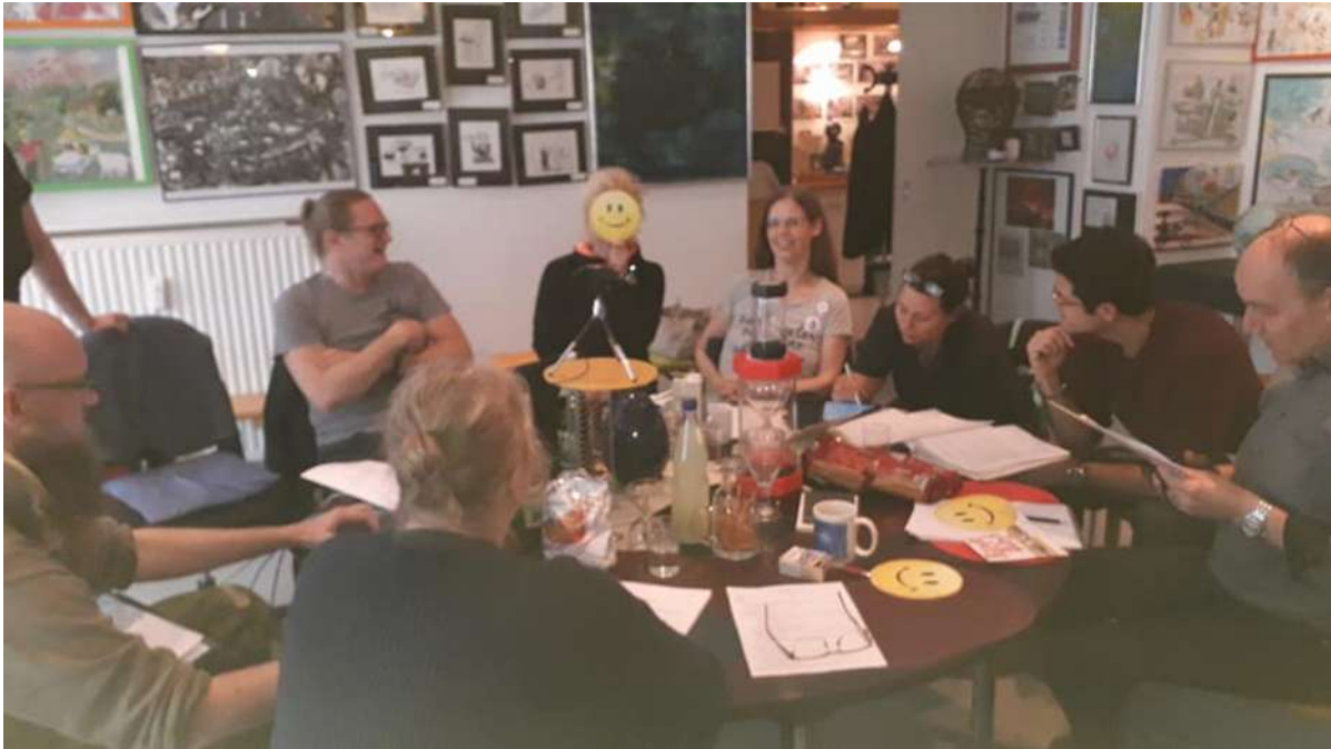
Gründungsversammlung von Basisdemokratie Jetzt

Basisdemokratie jetzt politische Partei nach dem Parteien- und Grundgesetz (rechtsfähiger, nichteingetragener Verein des privaten Rechts)